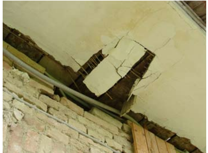
Laubengang Zerstörung im Zeitraffer ` 14