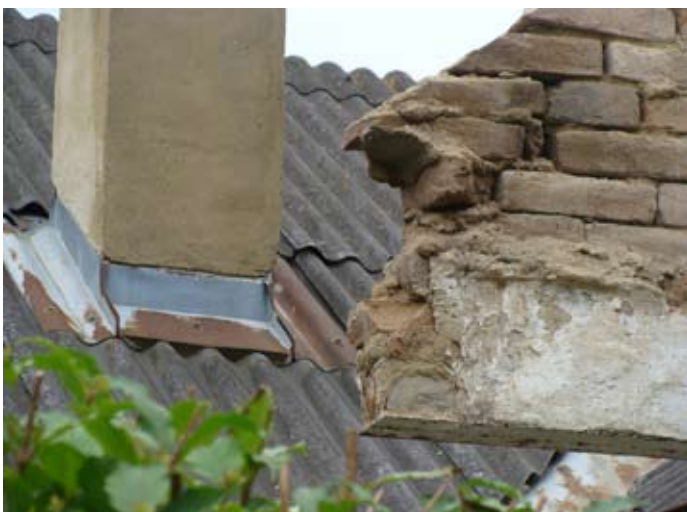
Firstecke fiel der Abdeckung zum Opfer