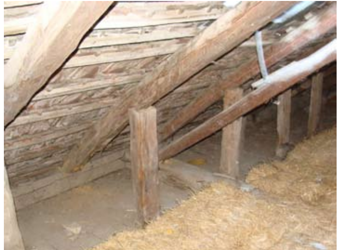
Laubengang innen O-Front 08/2014