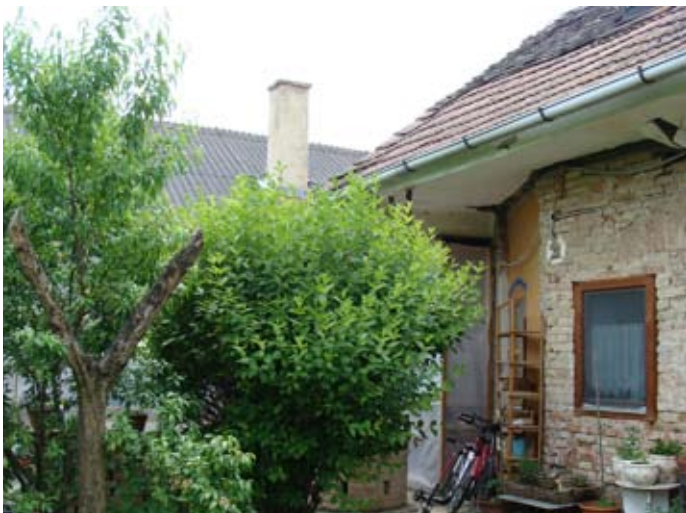
Hauptdach O-Front, S-Ecke 08/2014