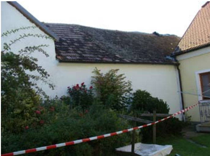
Hauptdach W-Front 08/2014

2013 - 2015 08/2014 - 10/2015 € 30.000,-