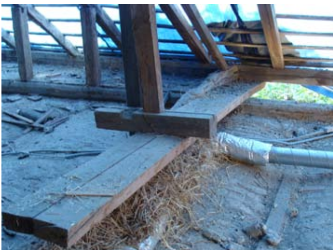
Ende eines Provisoriums 08/2014