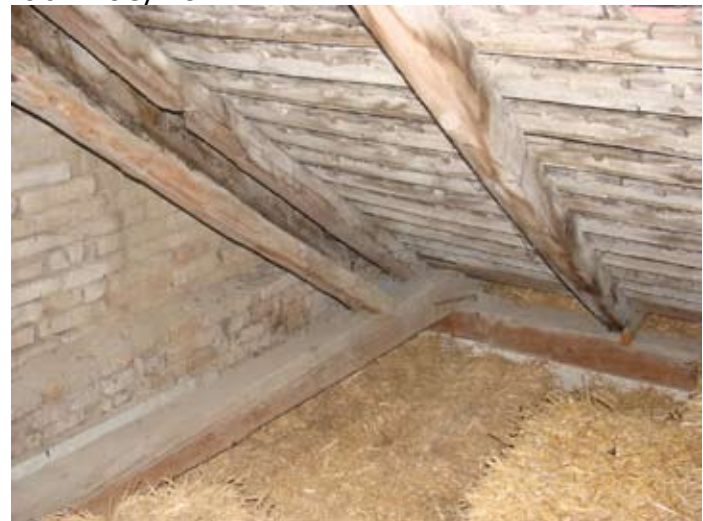
W-Front Ziegeldeckung S-Ecke Speis - Detail 08/2014