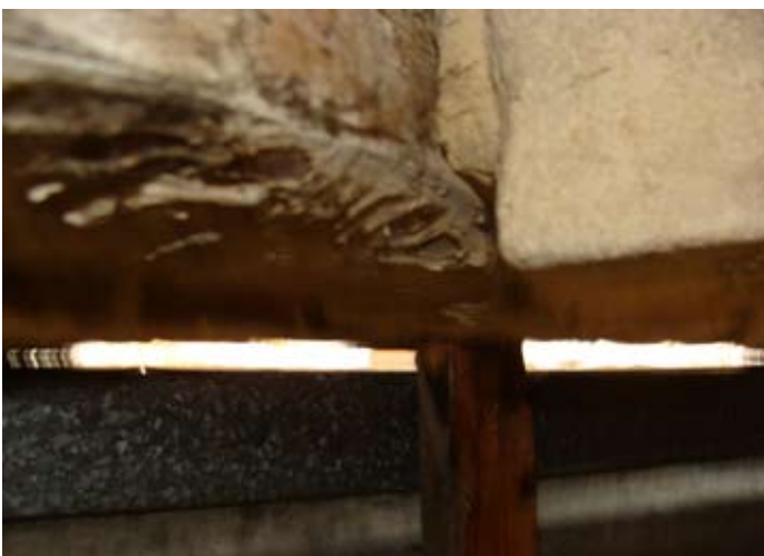
Holzschäden im Detail 08/2014