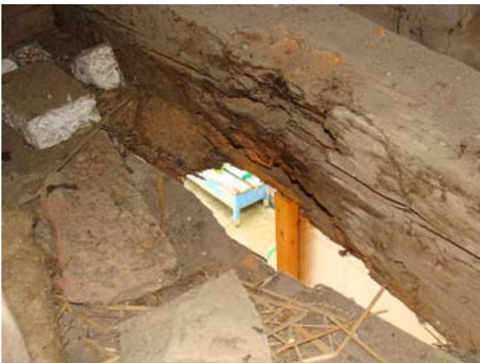
Holzschäden im Detail 08/2014