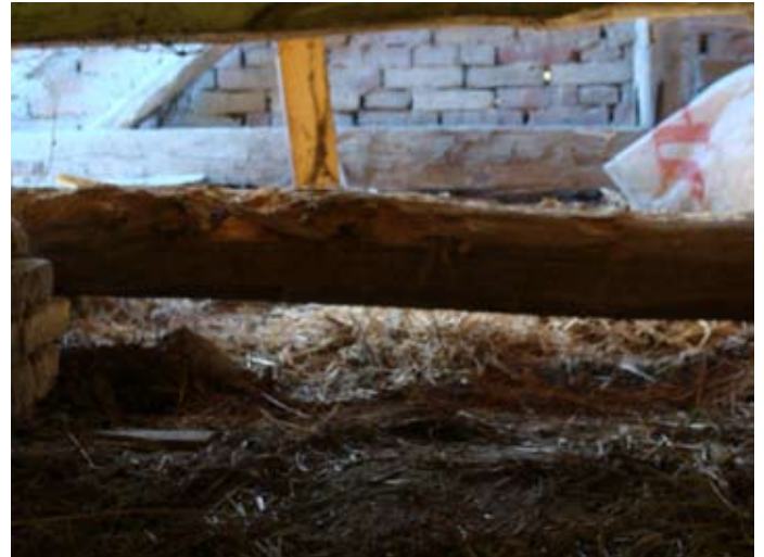
Holzschäden im Detail 08/2014