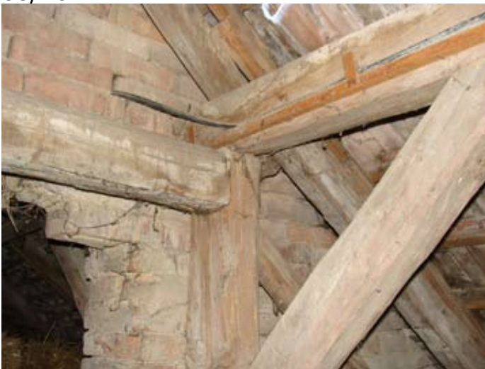
W-Front Ziegeldeckung S-Ecke Speis - Detail 08/2014