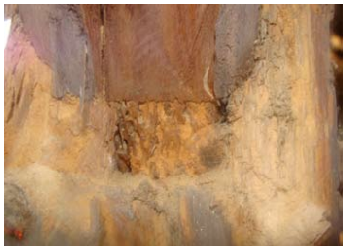
Holzschäden im Detail 08/2014