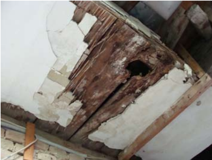
Laubengang Zerstörung im Zeitraffer `14

2013 - 2015 08/2014 - 10/2015 € 30.000,-