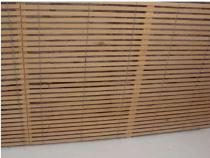
DACH NEU: Wasserschaden unter der hübschen Verlattung sichtbar