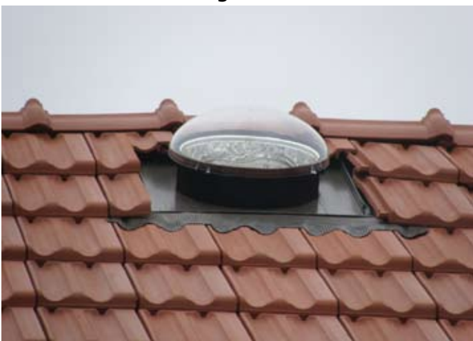
DACH NEU: ERGÄNZT 1,5 Lichttunnel