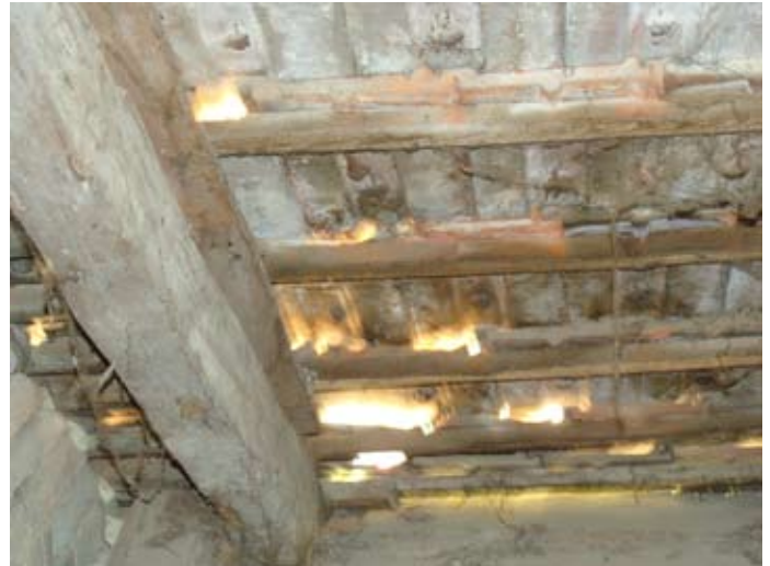
W-Front Ziegeldeckung S-Ecke Abstell- raum 08/2014