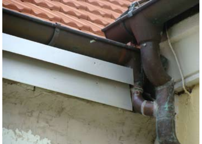
DACH NEU: Verblechung W-Front