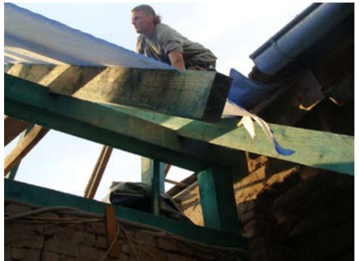
KALTDACH NEU - Dampfbremse