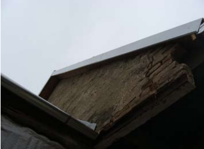
DACH NEU: Giebelwand Küche - Wetterschutz - nicht stilecht

2013 - 2015 08/2014 - 10/2015 € 30.000,-