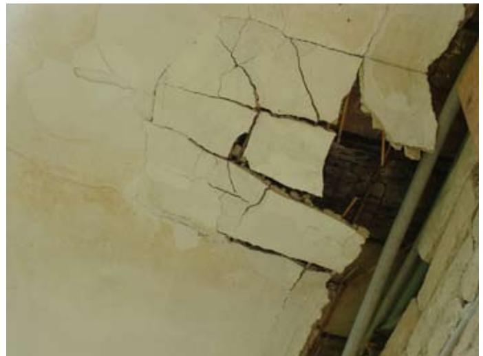
Laubengang Zerstörung im Zeitraffer ` 14