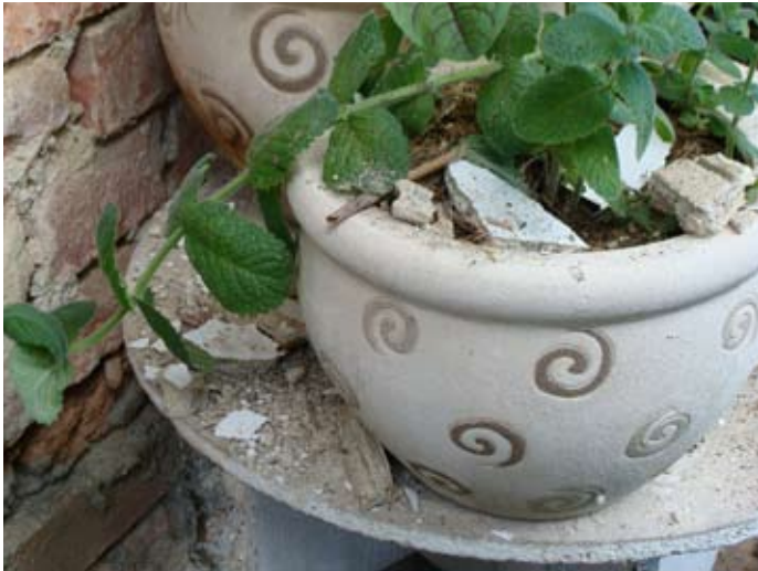
Laubengang - Putz löst sich ` 14

2013 - 2015 08/2014 - 10/2015 € 30.000,-