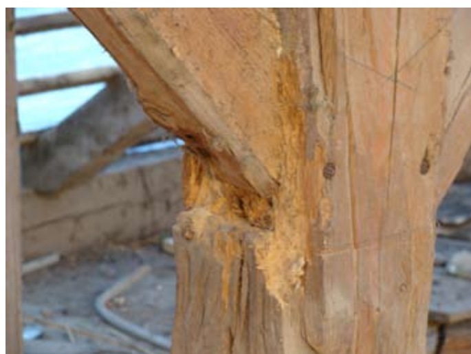
Holzschäden im Detail 08/2014