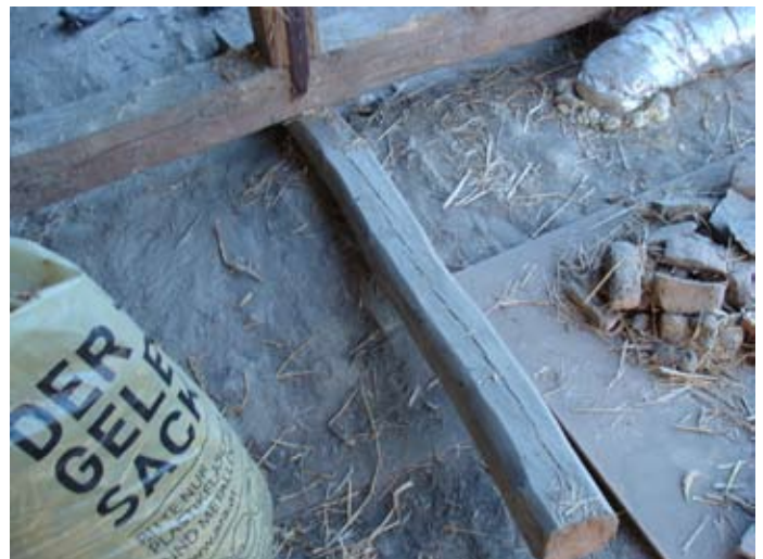
Ende eines Provisoriums, Detail 08/2014