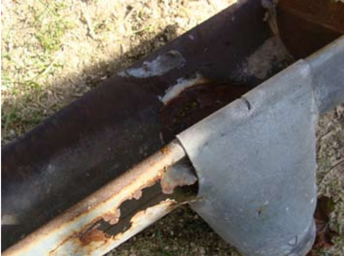
DACH alt - Blech am Ende 08/2014

2013 - 2015 08/2014 - 10/2015 € 30.000,-