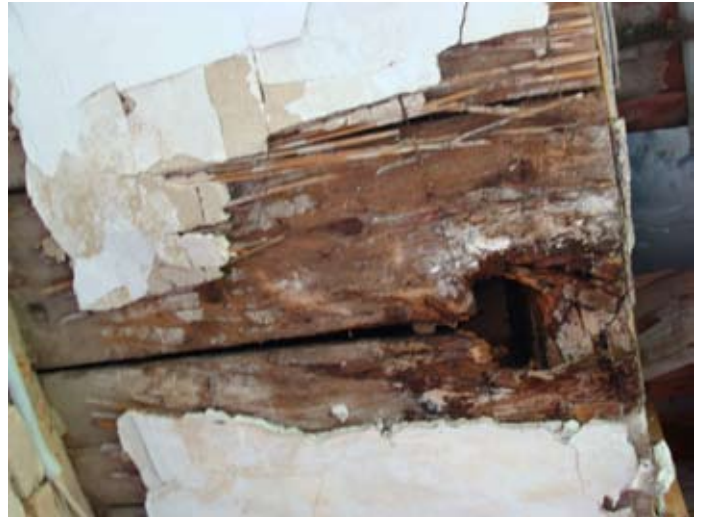
Laubengang Zerstörung im Zeitraffer `14