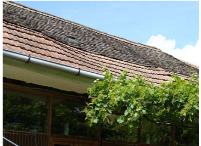
Hauptdach O-Front 08/2014