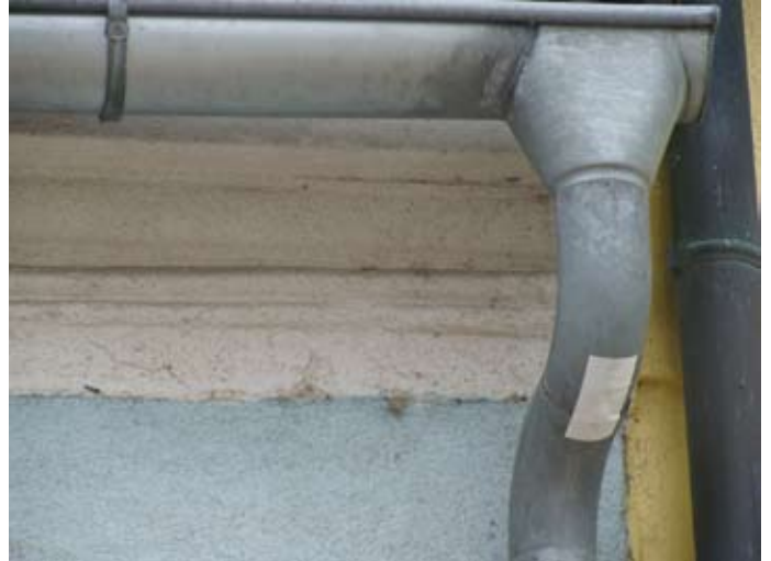
DACH NEU: Unprofessionell geklebtes Leck - Rohr getauscht