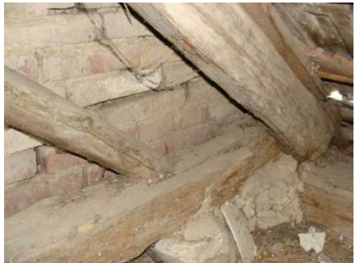
Laubengang innen N- Eck O-Front