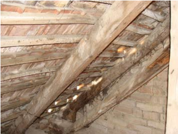
W-Front Ziegeldeckung N-Ecke Büro - 08/2014

2013 - 2015 08/2014 - 10/2015 € 30.000,-