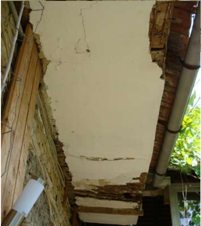
Laubengang Zerstörung im Zeitraffer ` 14