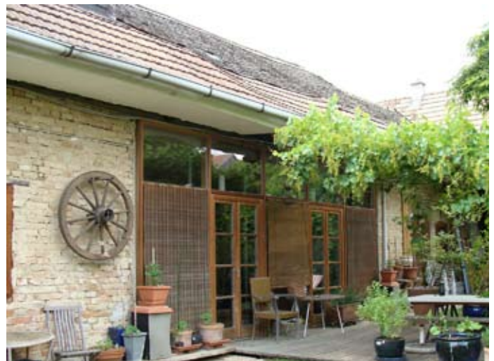
Hauptdach O-Front, N-Ecke 08/2014