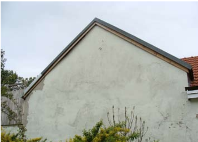
DACH NEU: W-Giebel - Wetterschutz