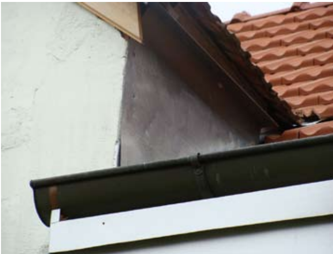
DACH NEU: Verblechung Giebel N-Front