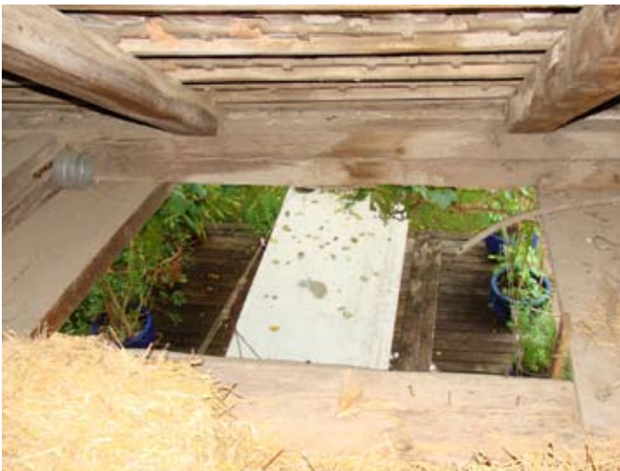
Laubengang innen Luke O-Front 08/2014