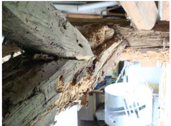
Laubengang Zerstörung im Zeitraffer `14