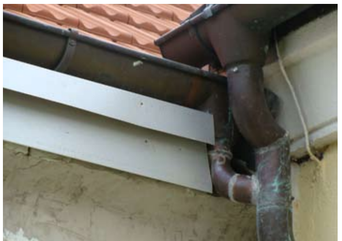
DACH NEU: Professioneller Regenablauf