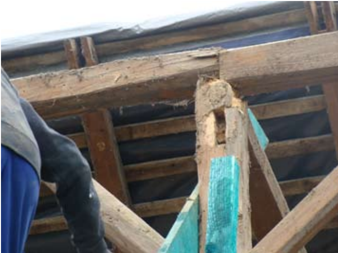
Holzschäden im Detail 08/2014

2013 - 2015 08/2014 - 10/2015 € 30.000,-