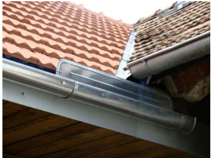
DACH NEU: Regenfächer