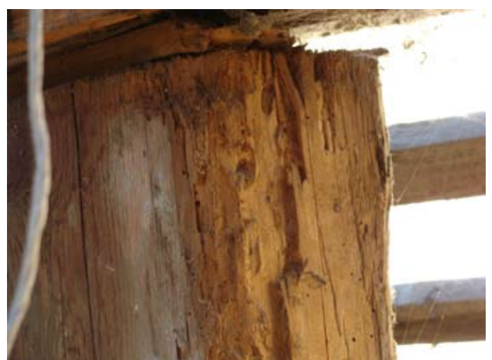
Holzschäden im Detail 08/2014