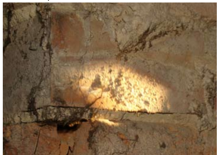
Ziegeldecke - Lichtspiele 08/2014