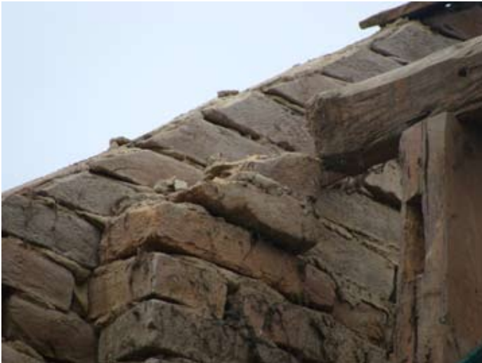
Giebelwand zur Küche - O-Front 08/2014

2013 - 2015 08/2014 - 10/2015 € 30.000,-