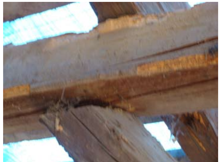
Holzschäden im Detail 08/2014