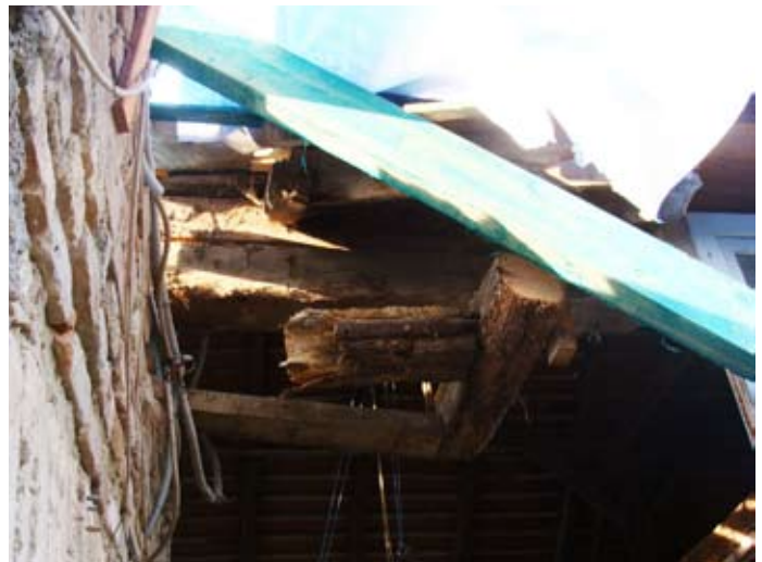
Laubengang Zerstörung im Zeitraffer `14