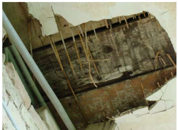
Laubengang Zerstörung im Zeitraffer ` 14