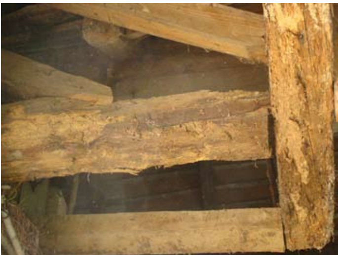
Laubengang Zerstörung im Zeitraffer `14