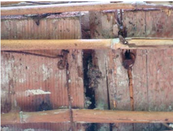
Laubengang Zerstörung im Zeitraffer `14