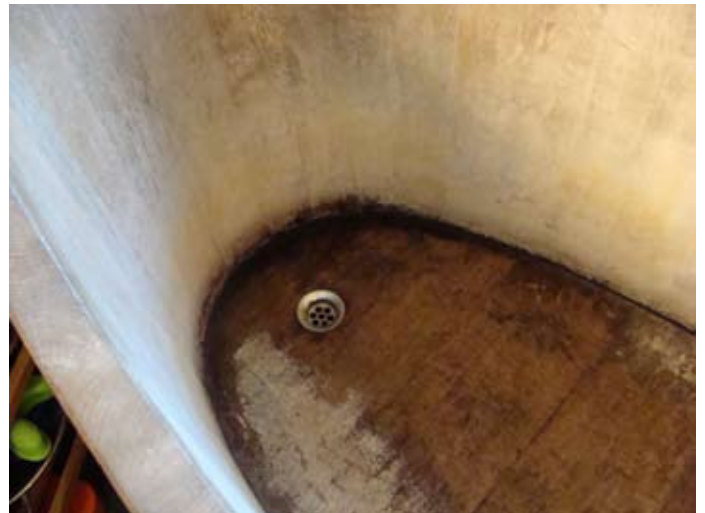
Kaputte Badewanne die II. Wartezeit von 13 Jahren auf eine Dusche nicht überlebt.