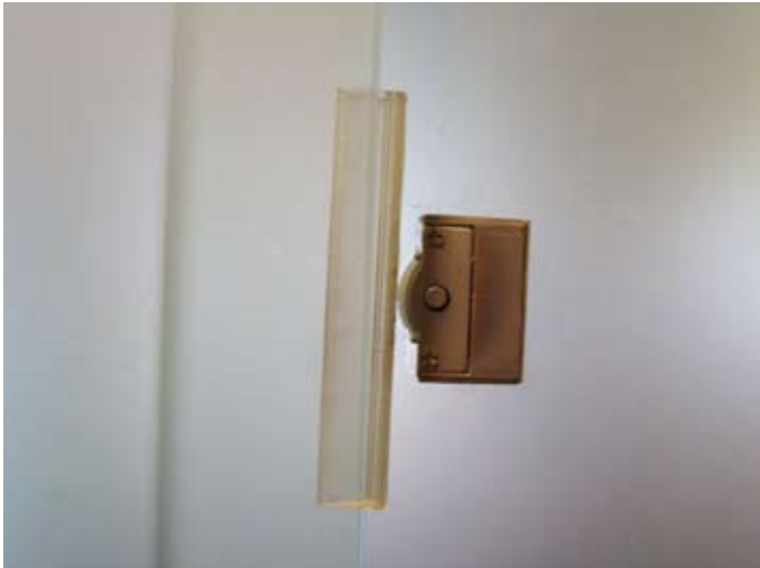
Loses Schloss wieder montiert Frühjahr 2014