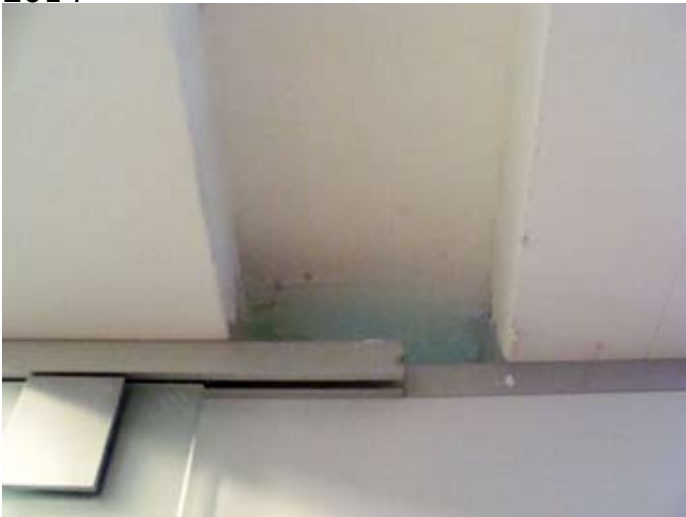
Spachtelarbeiten begonnen - Durchsicht in den Dachboden war möglich