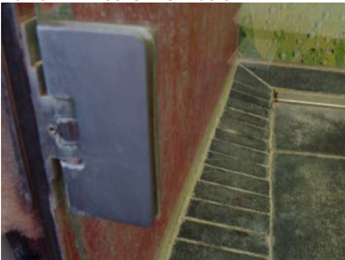
Falscher Materialmix bei 30°dWH. Der schwarze Schiefer verträgt keine Säure