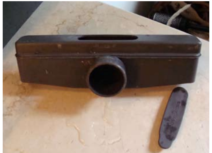
Planungsfehler: Zu geringe Höhe für Siphon - trotz auskoffern - „Spielzeug“ ist kaum zu reinigen. (Lt. Sanitär in Stetten)