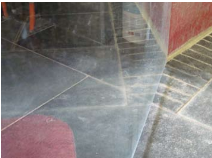
Dusch-Glaswand, Wände OHNE Beschichtung - trotz 30°dWH