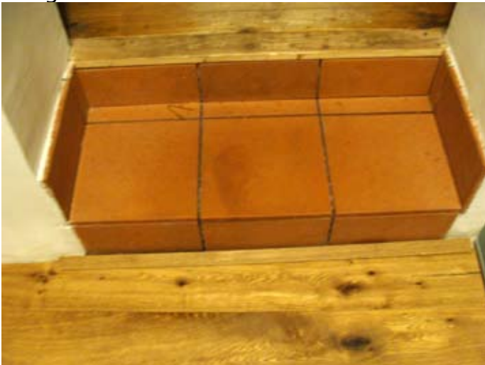
Fugen in den Cotto-Fliesen fehlen - Absicht? wegen Nässe im Boden?