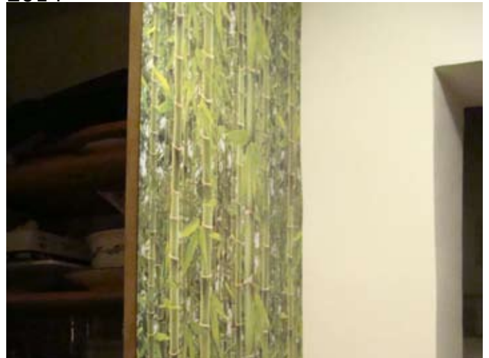
Dunkle Trennwand provisorisch mit Foto-tapete behübscht