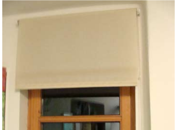
Rollo für mehr Privatsphäre NEU Frühjahr 2014