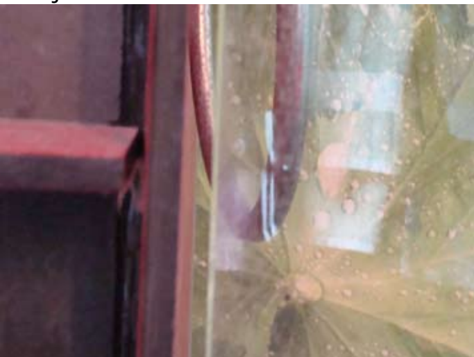
Vorhandene Silikonfuge beginnt zu reißen