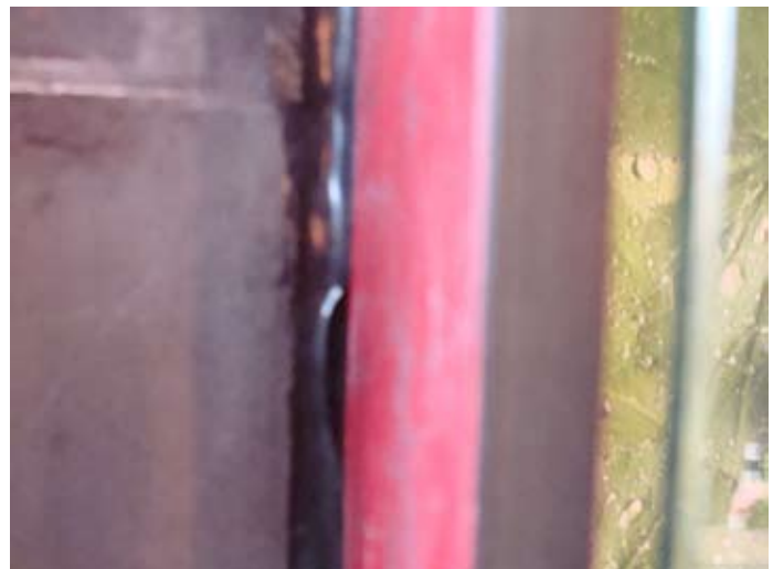
Risse im Silikon werden immer sichtbarer, Türen schlagen aneinander 01/2014