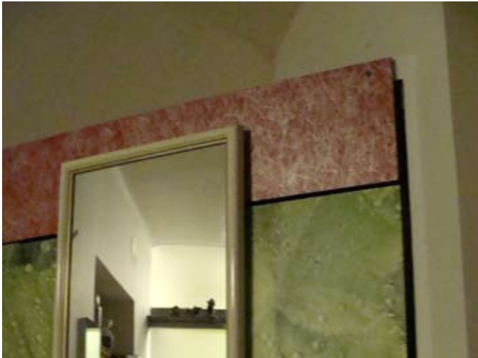
Verplattung falsch zugeschnitten. Hauptwasserhahn PER Akkubohrer erreichbar!