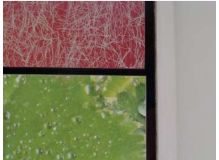
Design nach Maß - im Detail - verschmutzt dahinter