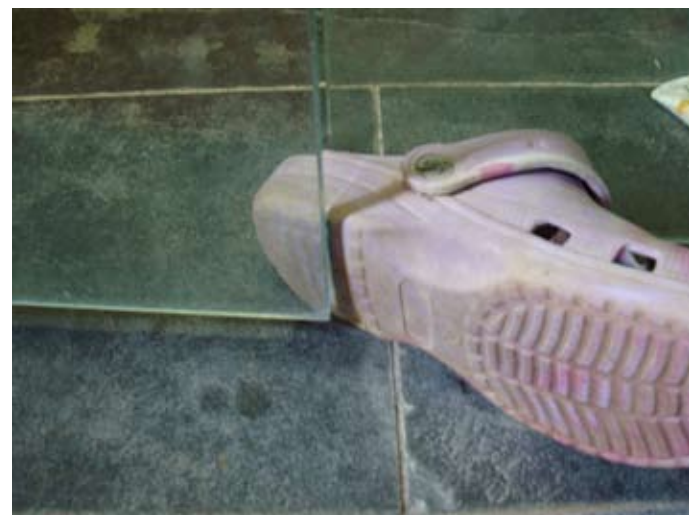
Top-Designer-Dusche mit elegantem Pan-toffel-Tür-Protector