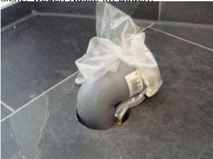
Fehlende Abdichtung zur Bodenisolierung beim Badewannenauslass