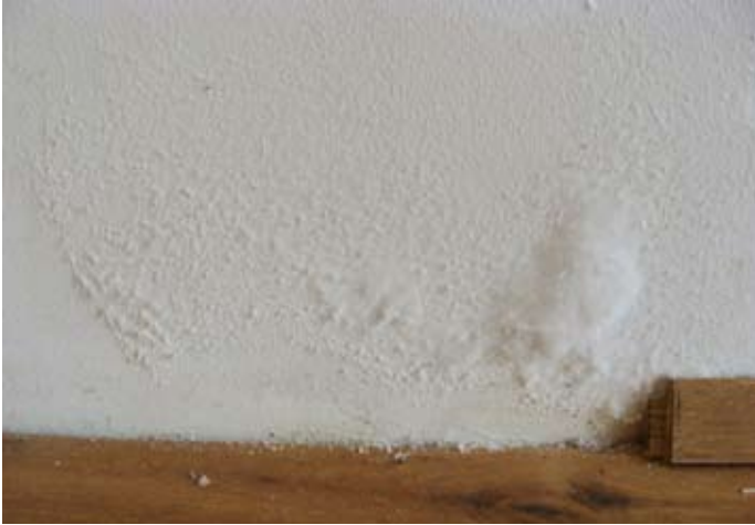
Fehlende Horizontallisolierung - Ausblühungen nach nur 6 Monaten