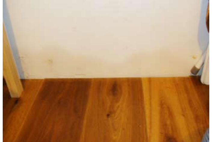
Fehlende Horizontalisolierung - Mauerfeuchte wird nach 1 Jahr sichtbar