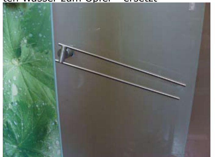
Designer-Halter mit Schieflage