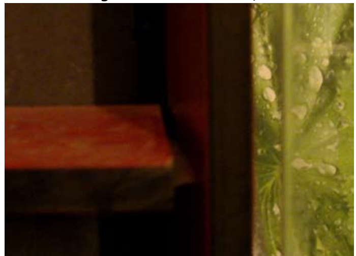
Status Quo Regalbrett 3 2014