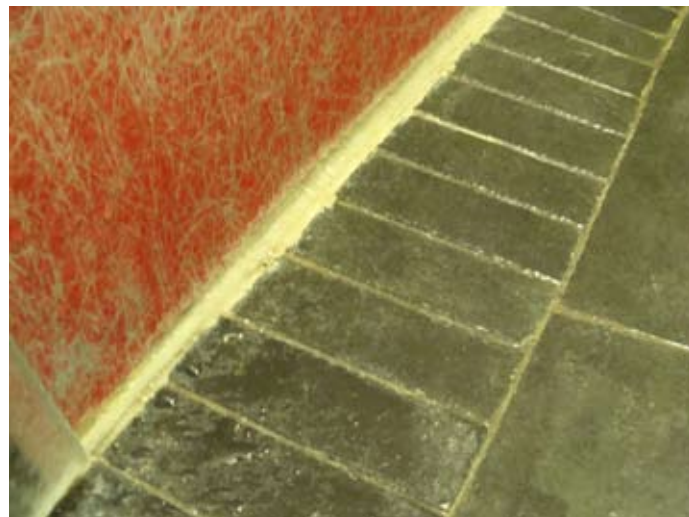
Rote Max-Platte - zuwenig hinterlüftet - biegt sich durch -PLANUNGSFEHLER