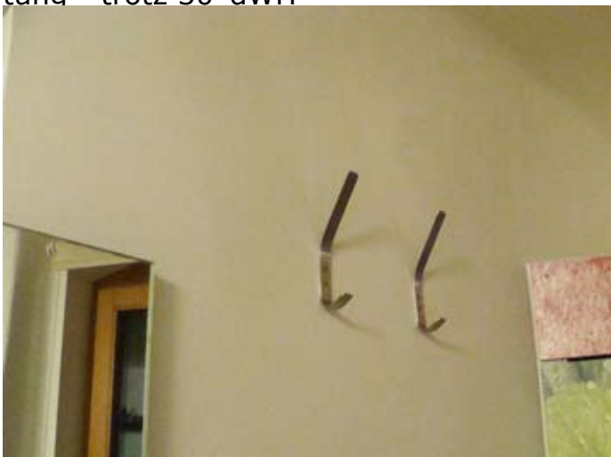
Ersatz-Wäschehalter montiert 2014