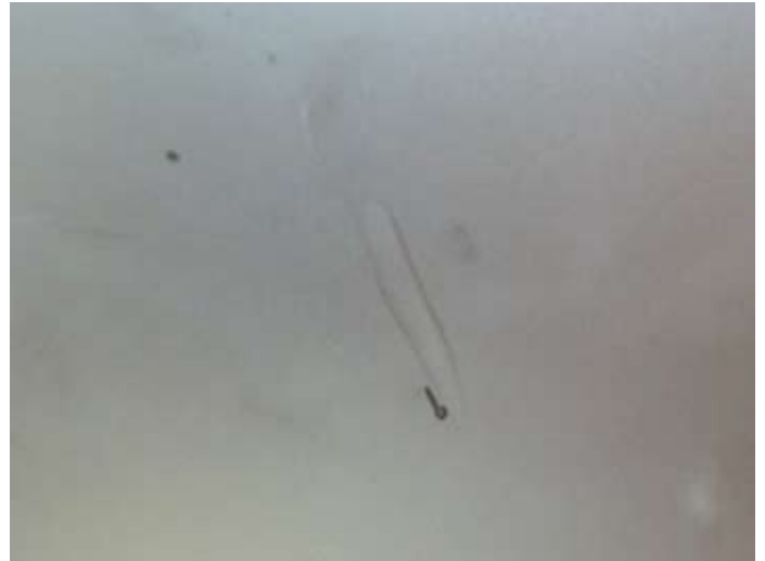
Irreparabler Schaden in der Milchglaswand - durch die Enge