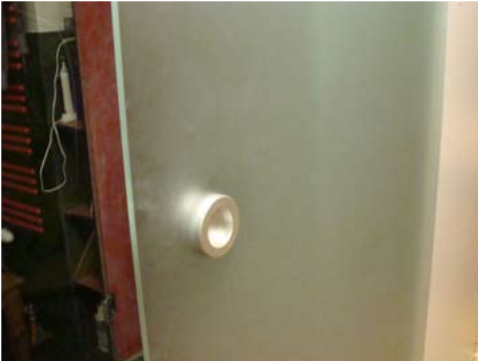
Im engen Durchgang wurde Milchglas gewählt - inzwischen zerkratzt