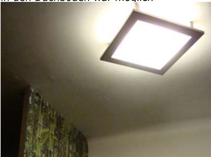
Funktionierenden Bewegungsmelder installiert