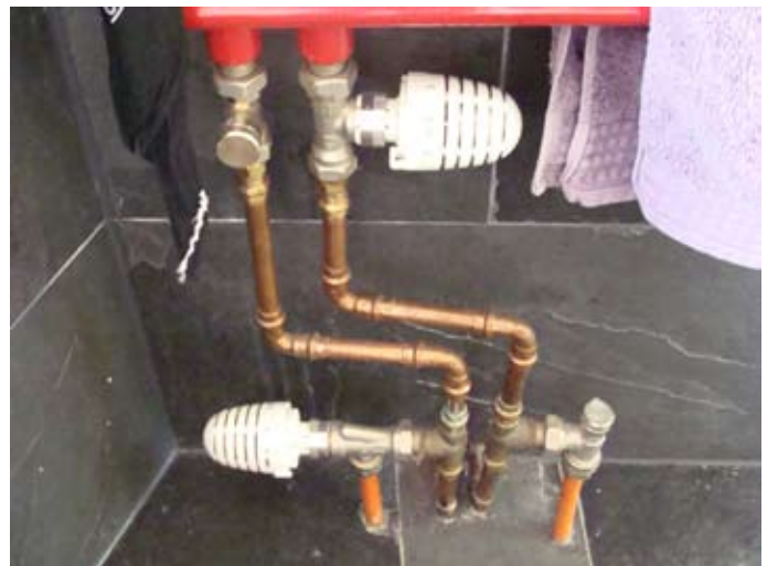
Funktionierende Thermostate getauscht - im GANZEN Haus