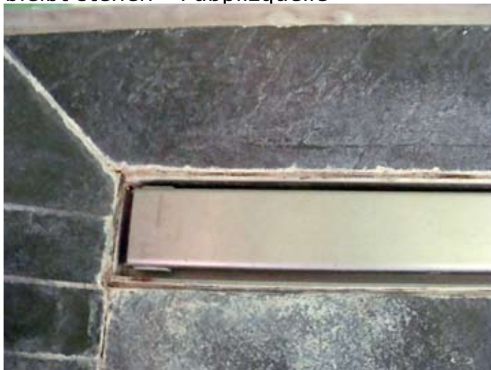
Abflussrinne - Verfugung bricht binnen 1 Jahr - Abstände zu gering