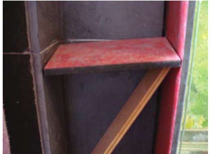
Status Quo Regalbrett 3 03/2016