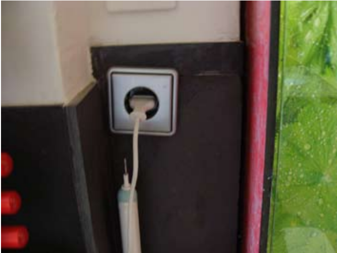
Das oberste Regalbrett musste bereits im Frühjahr 2014 entfernt werden