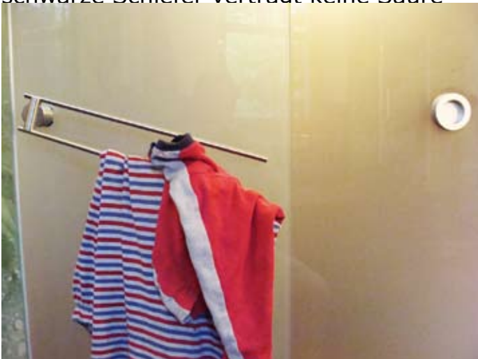
Designer-Halter mit Schieflage