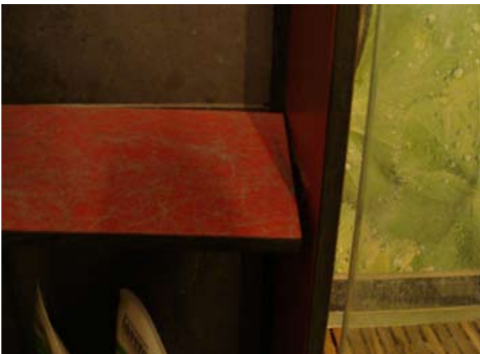
Status Quo Regalbrett 2 2014