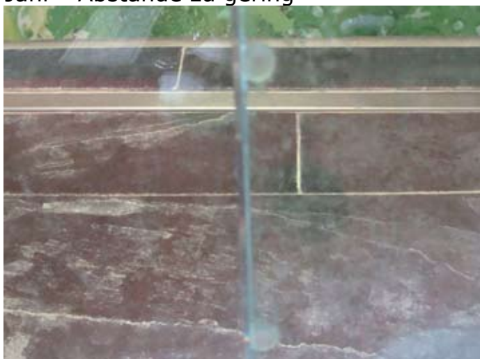
Status Quo Überlappung 03/2016