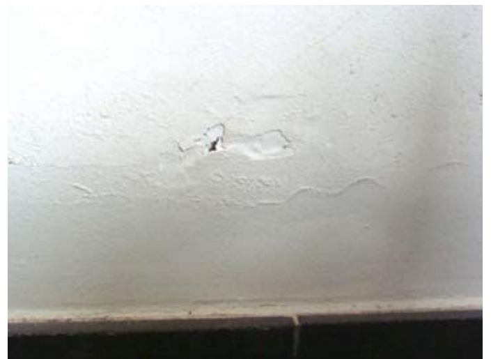
Putzschäden durch Mauerfeuchtigkeit