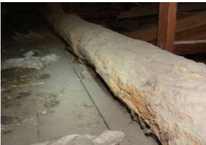
Die vermorschten Balken, die nassen Planken, die punktuelle abblätternde Farbe will DI Schuller nicht gesehen haben?