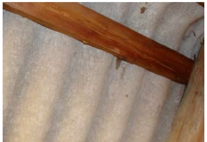
Momentaufnahme während eines Wolkenbruchs Ende 07|2016 - Schweizer Käse 4