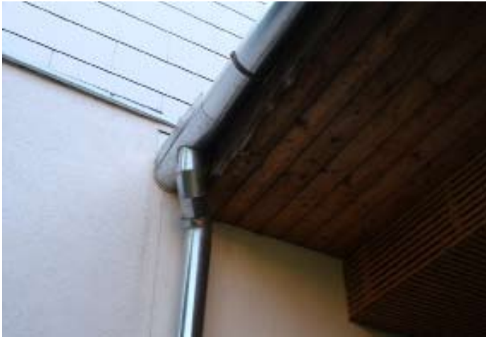
Der mit 2014 sanierte Dachrinnenanschluss ->