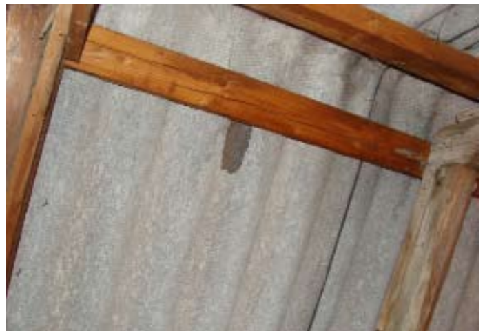
Momentaufnahme während eines Wolkenbruchs Ende 07|2016 - Schweizer Käse 7