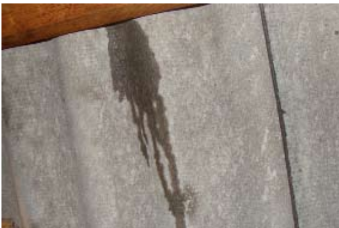
Momentaufnahme während eines Wolkenbruchs Ende 07|2016 - Schweizer Käse 1