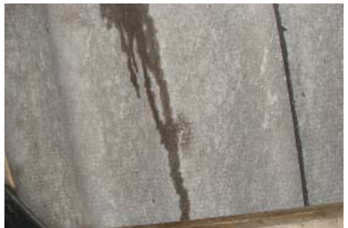
Momentaufnahme während eines Wolkenbruchs Ende 07|2016 - Schweizer Käse 2