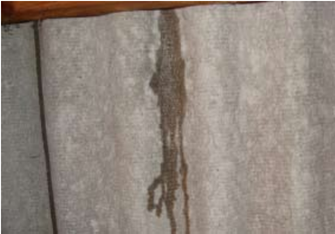
Momentaufnahme während eines Wolkenbruchs Ende 07|2016 - Schweizer Käse 10