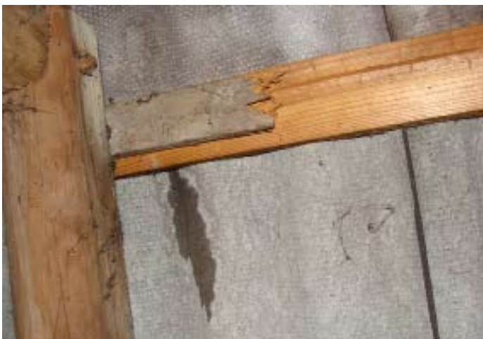
Momentaufnahme während eines Wolkenbruchs Ende 07|2016 - Schweizer Käse 3