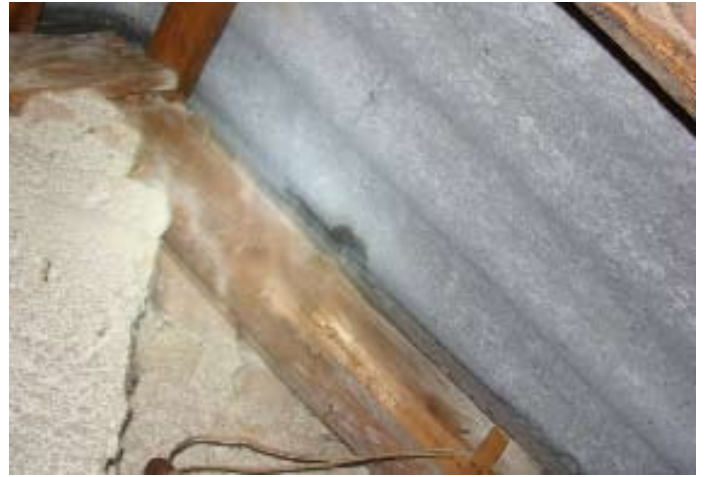
Momentaufnahme während eines Wolkenbruchs Ende 07|2016 - Schweizer Käse 11