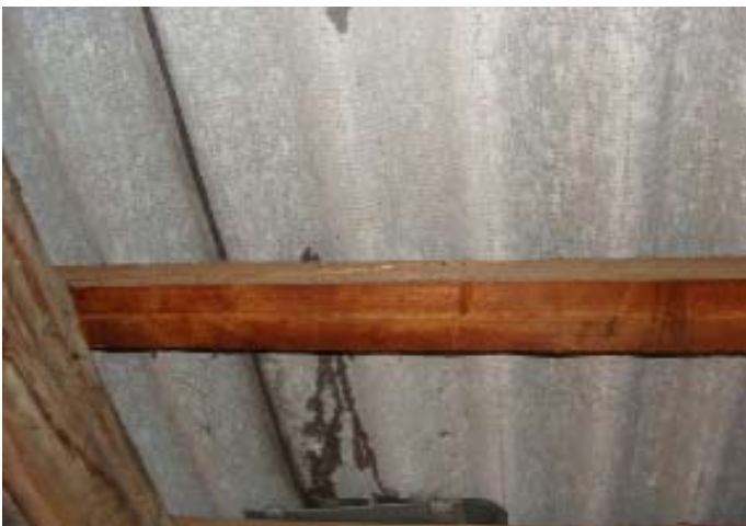
Momentaufnahme während eines Wolkenbruchs Ende 07|2016 - Schweizer Käse 12