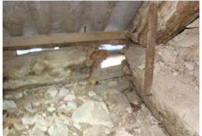
Direkt hinter dem Dachrinnenanschluss, verborgen unter der Verkleidung - ABGEMORSCHTER Balken 10x8