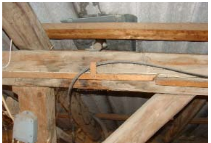
Momentaufnahme während eines Wolkenbruchs Ende 07|2016 - Schweizer Käse 9 - Direkt über dem Stromzählerkasten...