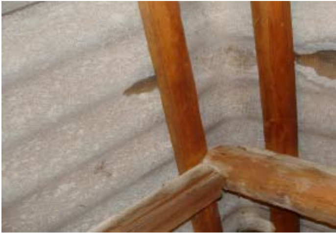
Momentaufnahme während eines Wolkenbruchs Ende 07|2016 - Schweizer Käse 5

Eine Freundin, HTL-Absolventin wies mich darauf hin, wie die Dichtheit zu erkennen ist: Bei Regen, Tageslicht einfach nach oben sehen - ohne Studium erkennbar.