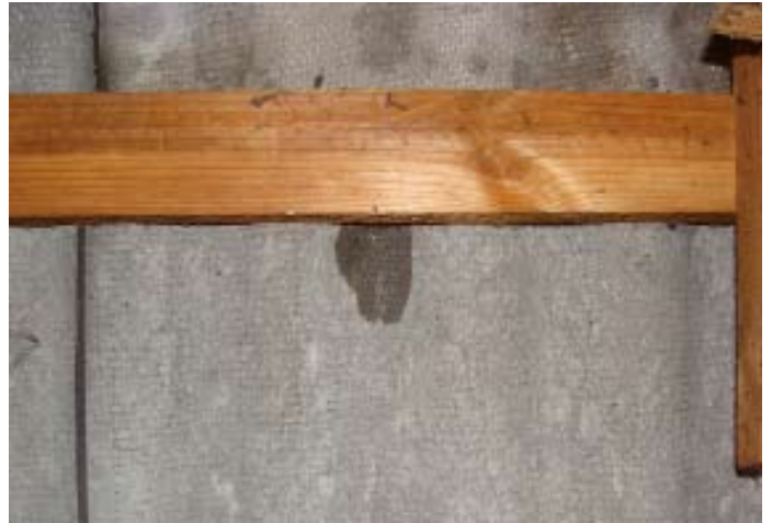
Momentaufnahme während eines Wolkenbruchs Ende 07|2016 - Schweizer Käse 6