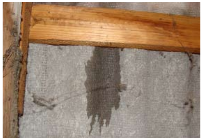
Schweizer Käse 13 - Dieser Schaden im Eternit ist als Wasserschaden in der Einfahrt sichtbar