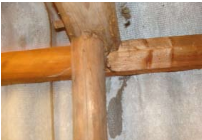
Momentaufnahme während eines Wolkenbruchs Ende 07|2016 - Schweizer Käse 8