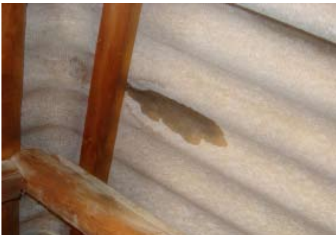
Momentaufnahme während eines Wolkenbruchs Ende 07|2016 - Schweizer Käse 5 - im Detail